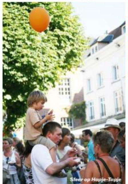
Steer op Hapje-Tapje