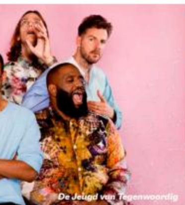
De Jeugd van Tegenwoordig