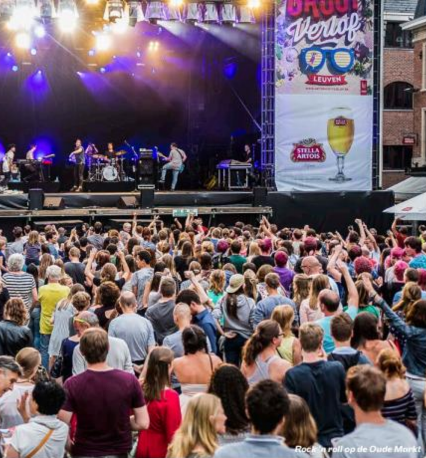
Rock'n roll op de Oude Markt